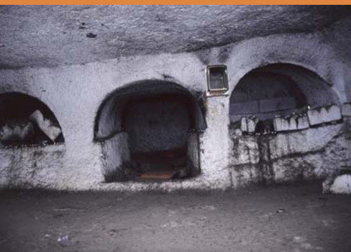
מערת הלל ועשרת הזקנים