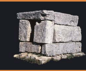
ציון קבר שמאי "שנדד" ממערת הלל להר שמנגד