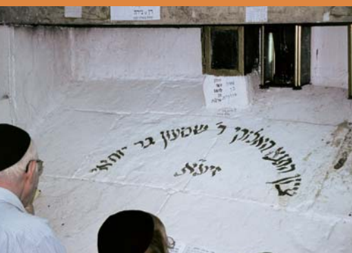
פנים קבר הרשב"י

עם מרד בר כוכבא: במסכת יבמות נמסר ש-12 אלף זוגות מתלמידי של ר' עקיבא מתו במגיפה בפרק זמן אחד, בין פסח לעצרת. מדובר כמובן ב-50 הימים שבין פסח לשבועות. על פי נוסחה פרשנית ("ספר המנהיג" מן המאה ה-12), אנו למדים שהאירוע הטראגי התחולל עד פרוס עצרת כלומר עד ליום י"ח באייר שהוא יום ה-33 לספירת העומר. ביום זה פסקה המגיפה. לכן בכל ימי ספירת העומר שבין פסח לעצרת נוהגים מנהגי אבלות למעט יום הל"ג בו אפשר "להתאושש" ולהפסיק ליום אחד את מנהגי האבלות (לכן גם מאפשרים נישואין). החיבור בין הפסקת המגיפה להצלתו של רשב"י - מגדולי תלמידיו של ר' עקיבא, שנתפס כמי שניצל מן המגיפה - היווה בסיס