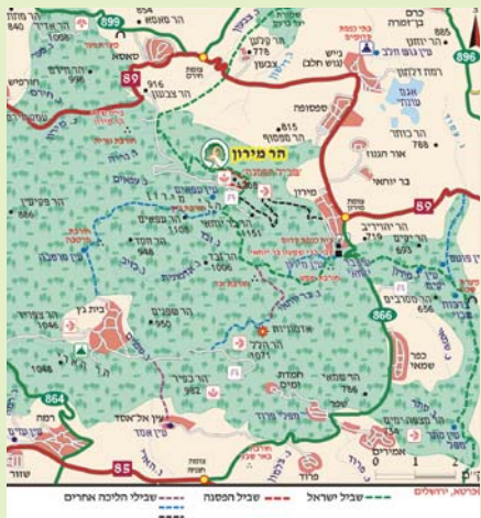
המפה באדיבות כרטא ירושלים

יש המזהים את האתר כתקוע הגלילית, מקום בית מדרשו של רשב"י. בית הכנסת נבנה ושוקם במאות ה-4-5 לספירה, והוא עדיין משמר בימה לארון הקודש, מזוזות גדולות מימדים, עמודים ובסיסיהם ומערכת פתחים בחלקו המערבי והצפוני של המבנה. מחוץ למתחם בית הכנסת נמצא גם מקווה טהרה. בין הממצאים שנתגלו בחפירת האתר נמצא משקוף שעליו חקוקה מגורת שבעת קנים ולמעלה משמונה מאות מטבעות שנתגלו בקופת הצדקה של הקהילה היהודית שחיה כאן בעת העתיקה.