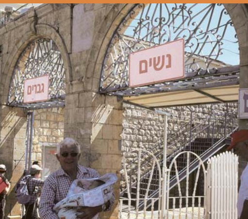
הכניסה לקבר רשב"י במירון